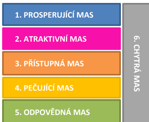
Obrázek 2 - Schéma strategických cílů

Pro dosažení stanovené vize, na základě veřejných projednání, bylo definováno šest strategických cílů. Jejich logiku představuje následující schéma.