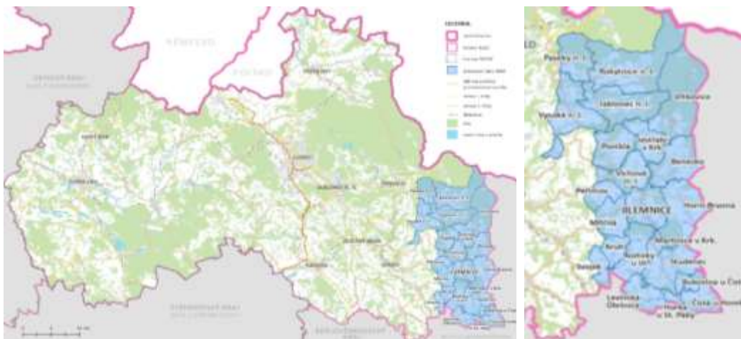
Obrázek 1 - Mapa MAS „Přidte pobejt!“ na území ČR, NUTS II, NUTS III

Z hlediska administrativního členění patří celé území MAS „Přidte pobejt!“ do okresu Semily.