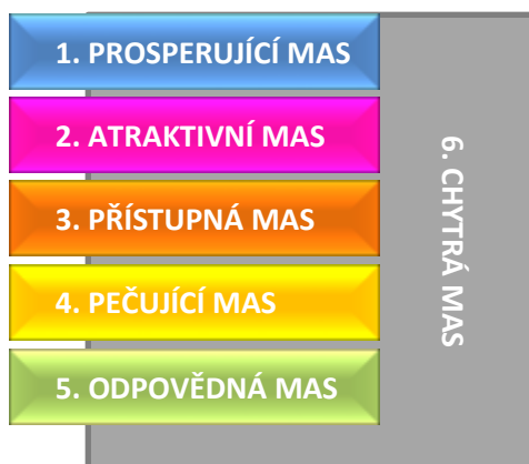
Obrázek 3 - Schéma strategických cílů a inovativní rysy SCLLD

Sama SCLLD si potom klade za cíl podporovat inovativní aktivity, které povedou k vyváženému rozvoji regionu v mnoha oblastech. Jedná se o podporu inovací jak technických, produktových, procesních, sociálních, tak organizačních tak marketingových. Jednoznačný pohled udává zaměření opatření specifického cíle 6.1 Chytrá řešení. MAS má ambice být nositelem role tzv. inovačního brokera ve svém zájmovém území.